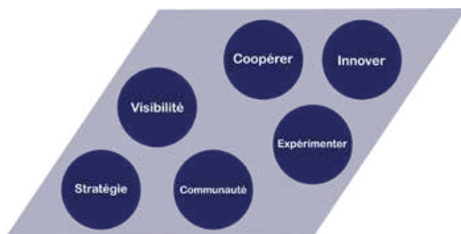
Illustration 2 Représentation des différentes étapes parcourues par le programme de prospective technologique. Il n'y a volontairement aucun ordre chronologique car toutes les étapes sont interdépendantes et s'influencent les unes avec les autres. On peut cependant relever que les trois de gauche sont représentées par des noms et pourraient former la base nécessaire aux trois suivantes, définies par des verbes, favorisant le mouvement et la création.

Le représentation de l'information (Illustration 4) et son mode de transmission sont des étapes importantes et fondamentales du processus de prospection.