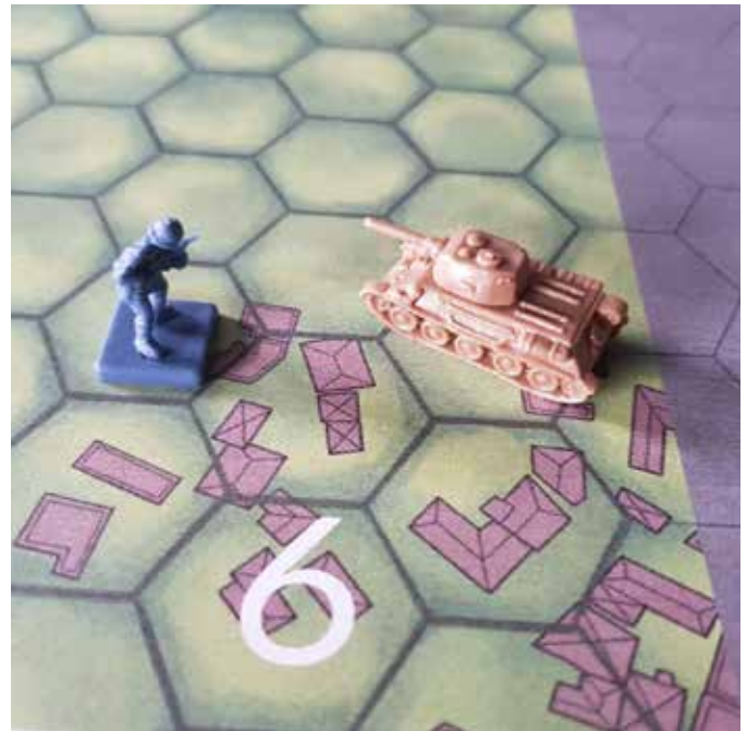
Illustration 9 : Le jeu sérieux ( serious game ) permet d'illustrer comment des technologies et des systèmes n'existant pas encore pourraient être utilisés lors d'engagements. Cette étape permet au joueur de s'appropriier le futur et de se rendre compte rapidement et simplement de la plus-value (ou non) de ces nouveaux éléments tout en considérant leurs possibles mises en situations et intégrations dans de nouvelles capacités militaires.

La prospective, technologique ou non, ne va que très rarement offrir des solutions précises, mais elle fournit les outils permettant de formuler les questions de manière plus précises. D'invisibles, les défis deviennent visibles, d'imprévisibles, ceux-ci se transforment en prédictibles et d'observatrice, la société peut devenir actrice.