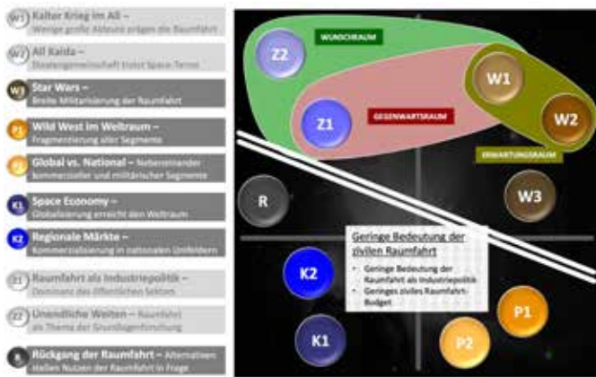
Illustration 6 : Représentation des différents scénarios créés pour le domaine spatial. W1 et W2 exposent les scénarios les plus probables, Z1 et Z2 les scénarios désirés. Il est possible de mesurer et d'analyser la distance séparant les deux cas de figure. Les paramètres importants à considérer sont identifiés et des actions concrètes peuvent être formulées.

également à un moindre coût! L'idée poursuivie ici est d'offrir aux participants la chance de mesurer l'apport ou non d'une nouvelle technologie. En jouant dans un premier temps une situation tactique (bleu contre rouge) avec les systèmes et procédures d'engagement actuels, puis en rejouant la même situation, mais cette fois en équipant l'un ou l'autre des belligérants avec un nouvel équipement, il est possible de se rendre compte de l'avantage (ou non) qu'il apporte. En facilitant la simulation et le jeu de différents environnements ainsi que la modification des paramètres des nouveaux systèmes et capacités, le joueur pourra expérimenter et de fait mieux assimiler l'importance d'une technologie qui, de fait, ne peut être disponible que dans un futur lointain.