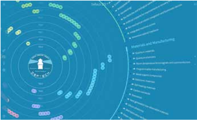
Illustration 4 : Plateforme collaborative DEFTECH (Defence Future Technologies) relative aux technologies. L'approche permet de visualiser rapidement différentes informations (maturité, liens entre technologies, etc.) ainsi que de partager le savoir de nombreux experts.

Une fois ces différents produits d'information réalisés, il était désormais possible de les présenter et de les offrir comme contributions « armasuisse » dans différents groupes de travail liés à la prospective au niveau national (inter-départemental) et international (EDA, OTAN, coopérations bilatérales, etc.).