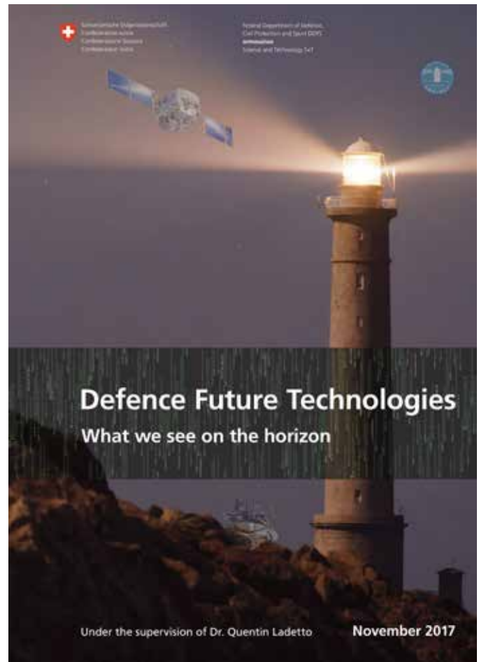
Illustration 7 : Page de couverture de la revue publiée en novembre 2017, regroupant 24 articles d'experts dans différents domaines technologiques.

CREDO est un outil d'aide à la décision issu des développements récents dans les domaines de la modélisation et de l'intelligence artificielle. C'est une interface essentiellement visuelle pour analyser