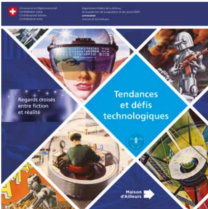
Illustration 8 : Les récits de science-fiction ont abordé dans les années 50-60 les domaines technologiques et les tendances se matérialisant aujourd'hui. Dans quels contextes ces technologies étaient-elles envisagées et quelles étaient les craintes ou espoirs associés ? Un parallèle est effectué dans cette publication entre la fiction et les développements bien réels visant à rendre celle-ci possible.

perspective technologique. Ces contributions cohérentes et complémentaires ont pour but de plonger le lecteur dans un environnement futuriste tout en lui fournissant toutes les informations nécessaires quant à la plausibilité de ce futur et au chemin nécessaire à parcourir pour y arriver. Enchanté ou effrayé, le lecteur aura la possibilité d'expérimenter ce futur de façon intrusive en se l'appropriant par le jeu. Est-ce la bonne formule ? Rendez-vous à la prochaine étape !