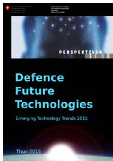
Illustration 3 : Premier document présentant un tour d'horizon à 360° des différents domaines technologiques présentant un intérêt particulier. L'ouvrage contient également 30 fiches décrivant une sélection de technologies dans un format succinct, aux thèmes rapidement identifiables.

Le représentation de l'information (Illustration 4) et son mode de transmission sont des étapes importantes et fondamentales du processus de prospection.