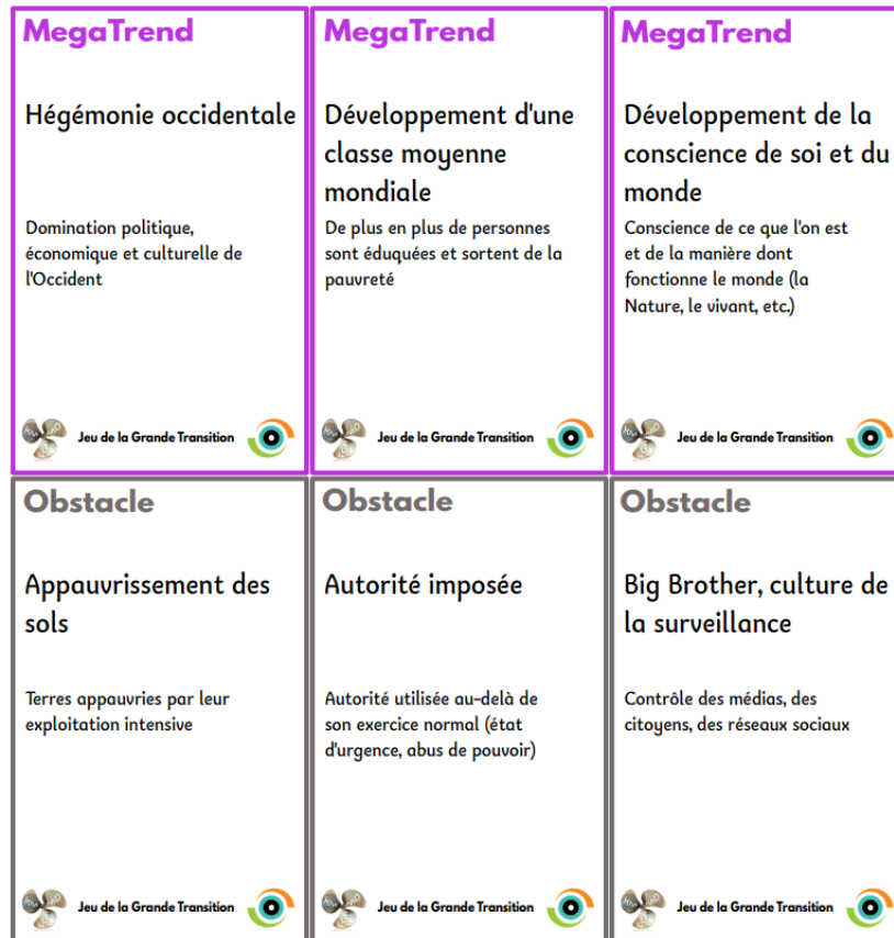
Figure 2. Exemples de cartes « Megatrend » et « Obstacle ».

joueurs. A la fin de cette phase de jeu les joueurs ont donc une main pleine de contraintes à relever. Maintenant que nous avons passé en revue les concepts de base du jeu nous pouvons aborder à la dernière phase : la phase de réflexion.